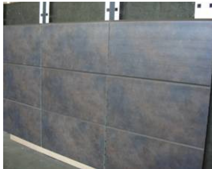
Montierte Platten Installed panels