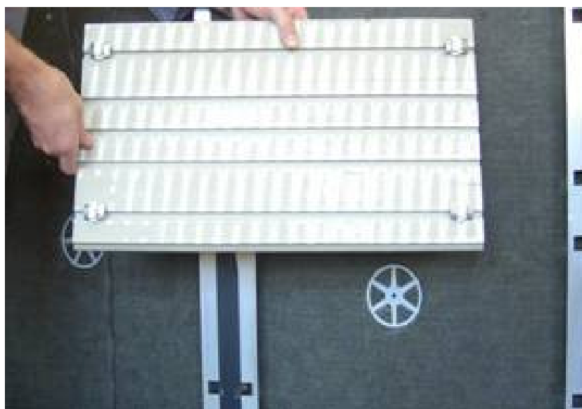
Platte mit mind. 4 Adaptionen Panel with 4 adaptors