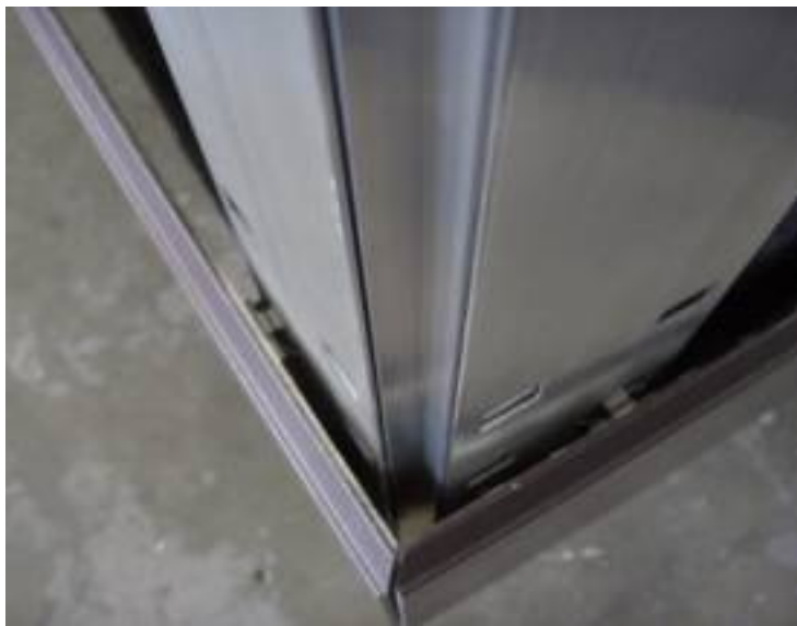
Platte mit Gehrungsschnitt (links) einhängen Hang on Mitre-cut panel (left)