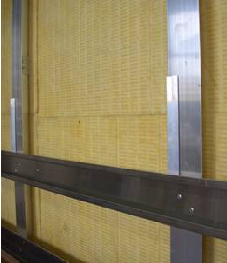
Horiz. Systemschienen mit vormontierter vert. Unterkonstruktion mittels zugel. Befestigungsmittel verbinden Fixing the horizontal system profile to the prepared vertically substructure. Use approved connecting pieces.