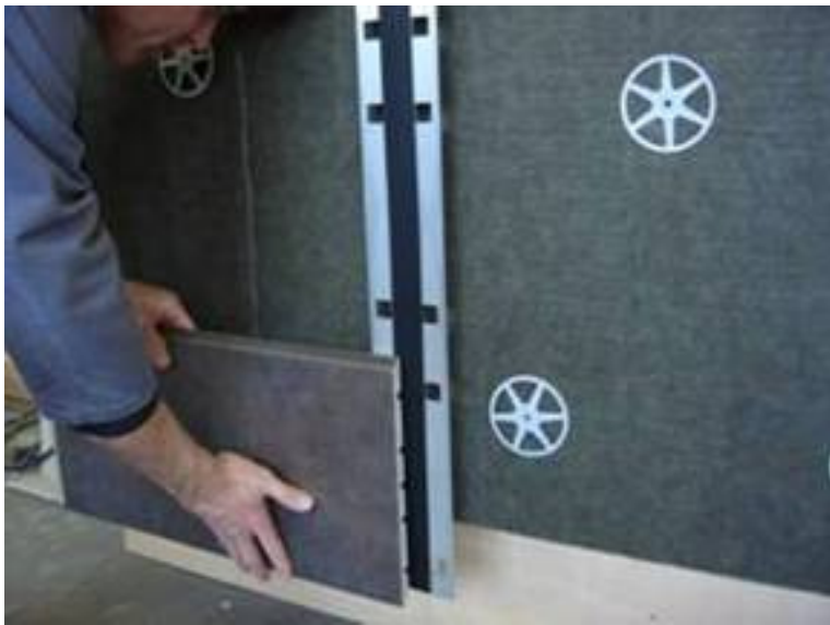
Platte in vorgestanzte Löcher der Profile einhängen Hang on the panel. Adaptors has to fit into the prepared holes