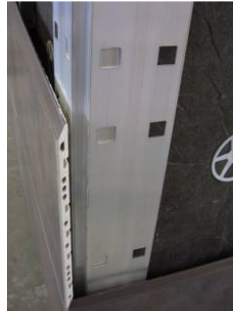
Platte mit Gehrungsschnitt (rechts) einhängen Hang on Mitre-cut panel (right)