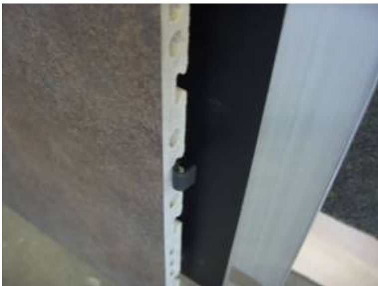
Sitz des Fugenabstandshalters F8 Position of the joint spacer F8