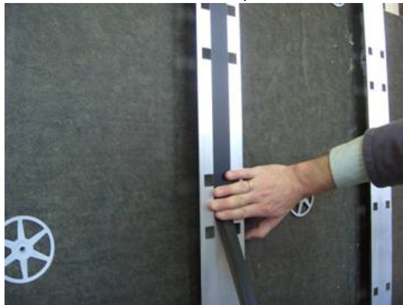
Aufkleben des Fugenbandes Art.-Nr. 506 Apply joint tape Art.-No. 506