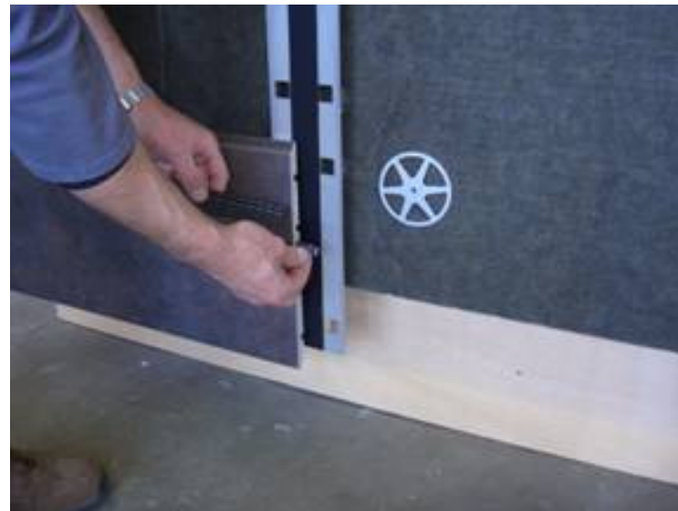
Fugenabstandshalter F8 Art.-Nr. 594 Joint spacer F8 Art. No. 594