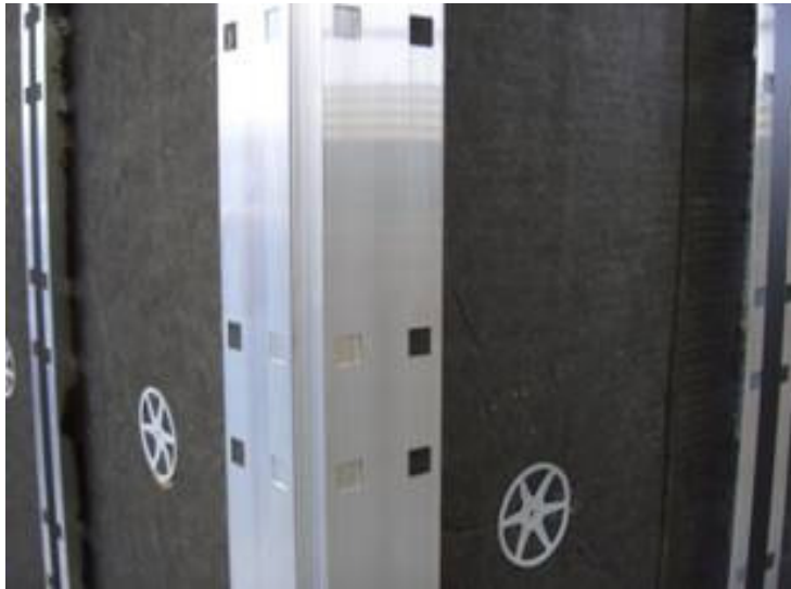
Vorgestanzte Schienen auf Eckprofil montieren Profile with prepared holes are fixed onto Corner profiles