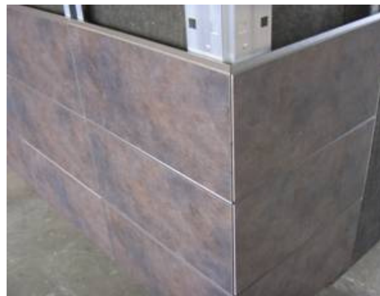
Montierte Ecke Installed corner section