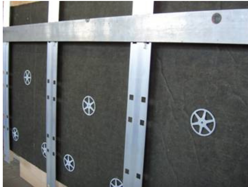
Lotrechte Montage der Tragprofile Exact levelled installation of the profiles