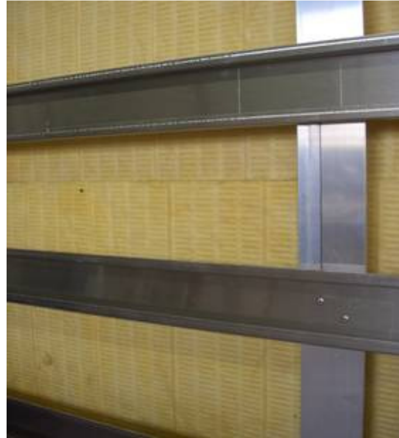
Horiz. Systemschienen mit vormontierter vert. Unterkonstruktion mittels zugel. Befestigungsmittel verbinden. Exakten Rasterabstand einhalten! (Verwendung von Abstgandhaltern) Fixing the horizontal system profile to the prepared vertically substructure. Use approved connecting pieces. Spacers can be used to get the exact distance between the horiz. Profiles.